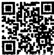
QR Code นิยามผู้ป่วยฯ