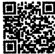
QR Code สำหรับตรวจสอบค่า PM ๒.๕