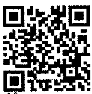
คำแนะนำในการดูแลสุขภาพจากปัญหาฝุ่นละอองขนาดเล็ก

ผบ.ทบ./ผอ.ศบภ.ทบ. มีความห่วงใยในสุขภาพของ กำลังพล ครอบครัว ชุมชนทหาร และหน่วยทหารที่ได้รับผลกระทบจากฝุ่นละอองขนาดเล็ก (PM ๒.๕) ที่เกินค่ามาตรฐาน ในห้วง ๒ สัปดาห์ที่ผ่านมา เพื่อให้การป้องกันอันตรายที่จะเกิดจากฝุ่นละอองขนาดเล็ก (PM ๒.๕) พบ. จึงขอให้ รพ.ทบ., พัน.สร. และหน่วยสายแพทย์ ได้ดำเนินการประชาสัมพันธ์แจ้งถึงอันตราย พร้อมทั้งให้ กำลังพล ครอบครัว ชุมชนทหาร และหน่วยทหาร ที่อยู่ในความรับผิดชอบ ได้ปฏิบัติตามคำแนะนำในการดูแลสุขภาพจากปัญหาฝุ่นละอองขนาดเล็ก (PM ๒.๕) อย่างเคร่งครัด ทั้งนี้ สามารถสแกนคิวอาร์โค้ดคำแนะนำ หรือประสานรายละเอียดเพิ่มเติมได้ที่ พบ.(กสวป.พบ.) หมายเลขโทรศัพท์ ๐ ๒๓๕๔ ๔๔๒๑ หรือ โทร.ทบ. ๙๔๔๒๔